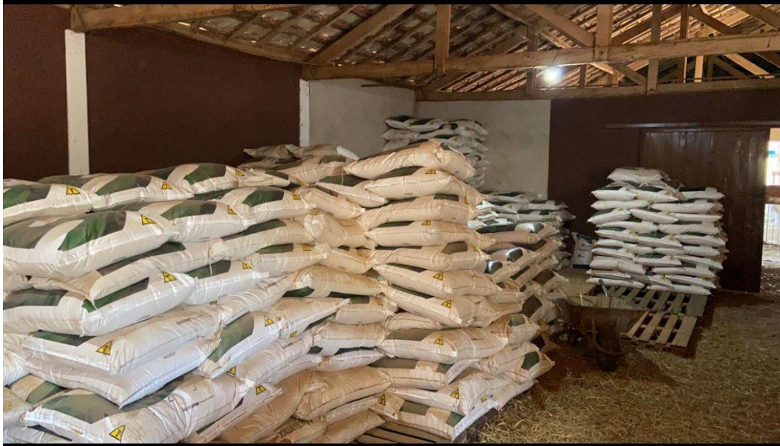
Figura 3 – Alimentação concentrada com os respectivos aditivos utilizada no experimento.

fitoativos; T4 – associação de monensina, flavomicina e dois gramas de blend de fitoativos. O blend de fitoativos testado foi elaborado a partir de óleos essenciais de canela e orégano, extrato de cúrcuma e ácido tânico (Figura 3).