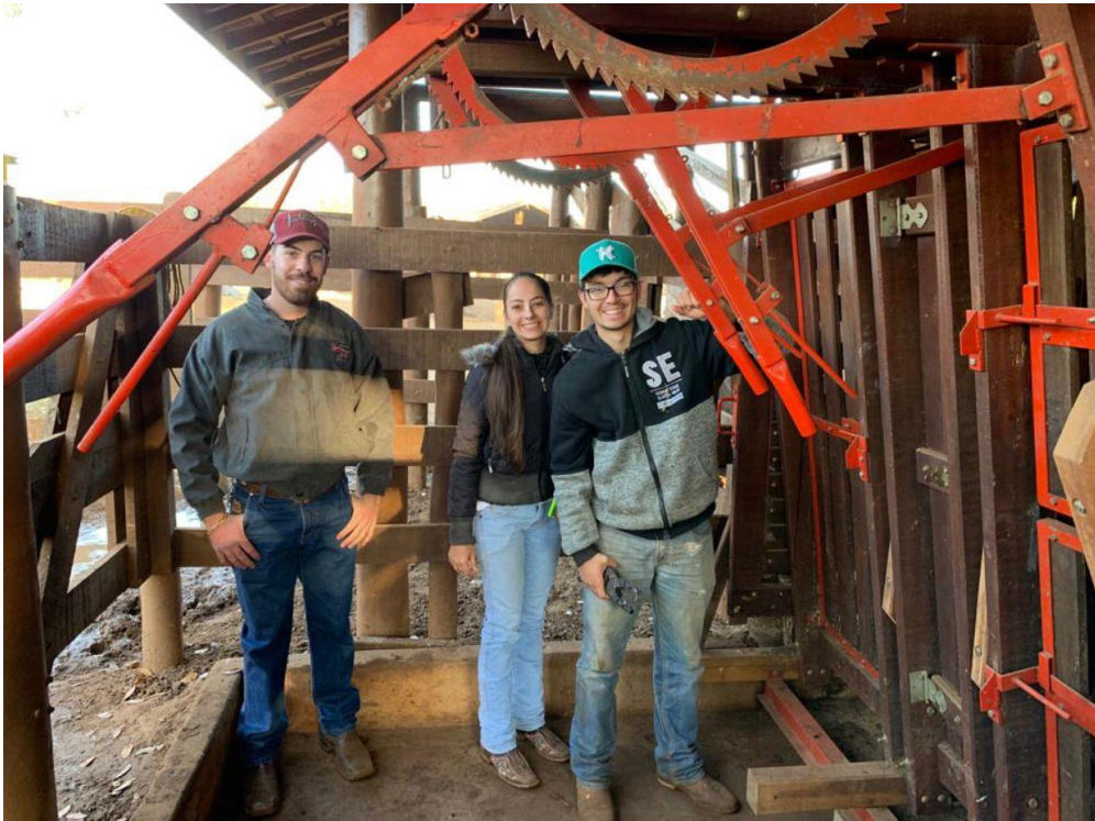
Figura 4 – Pesagem dos animais e colocação de brincos para identificação.

A partir dos dados de consumo de matéria seca diário individual da dieta e ganho médio diário, foi calculado a conversão alimentar (kg matéria seca/kg de ganho de peso) e eficiência alimentar (kg de ganho de peso vivo/kg matéria seca ingerida).