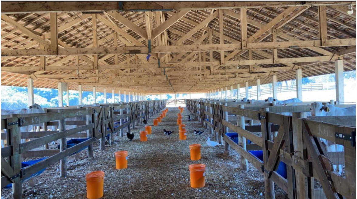
Figura 2 – Confinamento com baias individualizadas e piso revestido com pó de serra.

Os animais foram alocados em baias individuais de piso concretado, com 12 m 2 , com comedouros individuais e bebedouros com capacidade de 100L divididos para dois animais. As baias foram construídas em barracão totalmente coberto (Figura 2). O piso foi revestido de pó de serra para aumentar o conforto dos animais durante o período experimental.