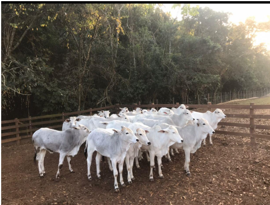
Figura 1- Novilhas Nelore selecionadas para o experimento.

Foram utilizadas 20 novilhas da raça Nelore, com idade aproximada de 15 meses e 282,4 \pm 18,8 kg de peso vivo inicial, distribuídas aleatoriamente em quatro grupos contendo cinco animais por tratamento (Figura 1). Antes de serem alojados nas baias, os animais foram pesados, identificados por brincos com numeração e examinados clinicamente por um médico veterinário. Todas as novilhas foram desvermifugadas com Ivermectina 1% e pulverizadas com carrapaticida e inseticida à base de fipronil para controle sanitário de ectoparasitas.