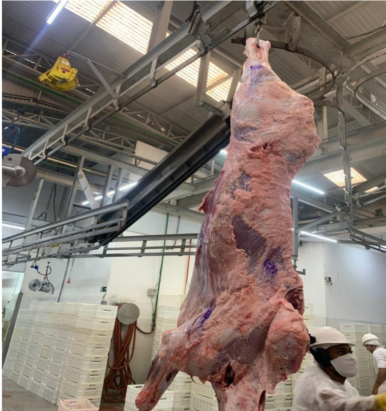
Figura 5 – Carcaça de novilha identificada para avaliação do rendimento da carcaça.